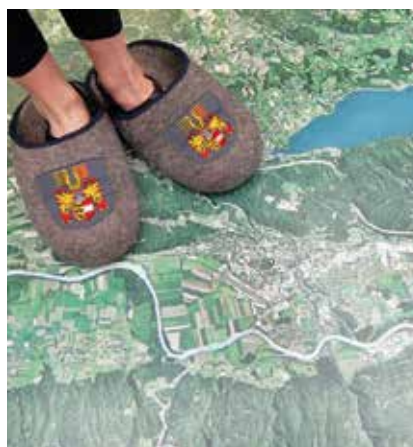
Kärnten-Panorama im Museum für Volkskultur im Schloss Porcia