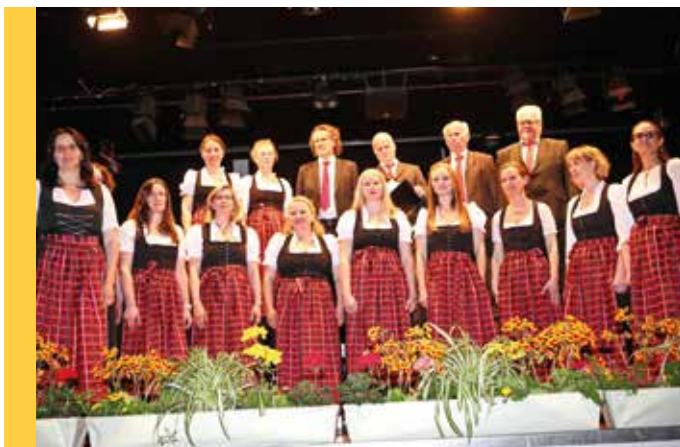
Die „Stimmen aus Amlach“ waren Teil des Auftakts der Volkskult-Serie „Singen vom Feinsten“