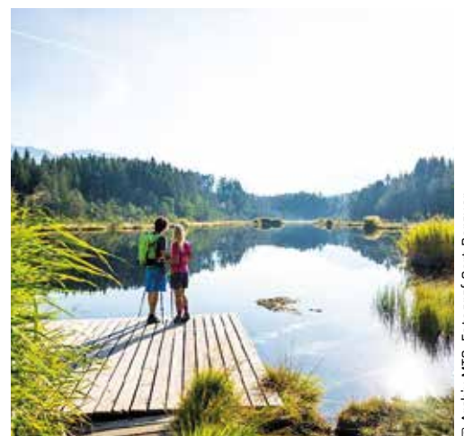
Naturparadies Egelsee am Wolfsberg