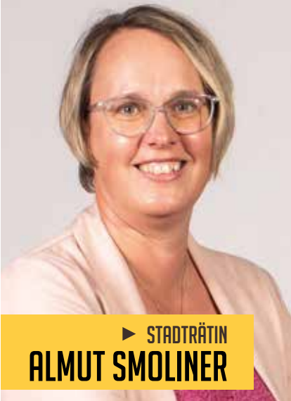
▶ STADTRÄTIN ALMUT SMOLINER